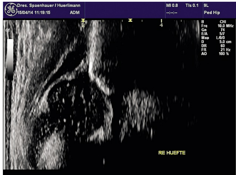
Abbildung 1: rechte Hüfte im Alter von 2 Wochen.

Siehe Abb. 1 und 2 im Alter von 2 Wochen sowie Abb. 3 im Alter von 4 Wochen.